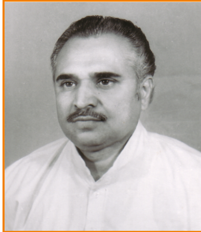
સ્વ. ભાસ્કરરાવ ભાનુશંકર ઠાકર કાર્યકાળ : સને ૧૯૬૭-૬૮ થી સને ૧૯૬૮-૬૯ અને સને ૧૯૭૮-૭૯ થી સને ૧૯૮૫-૮૬